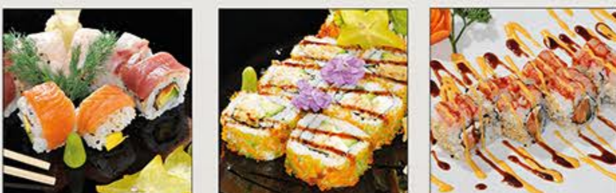
California Dream Softshell Maki Rosa Maki