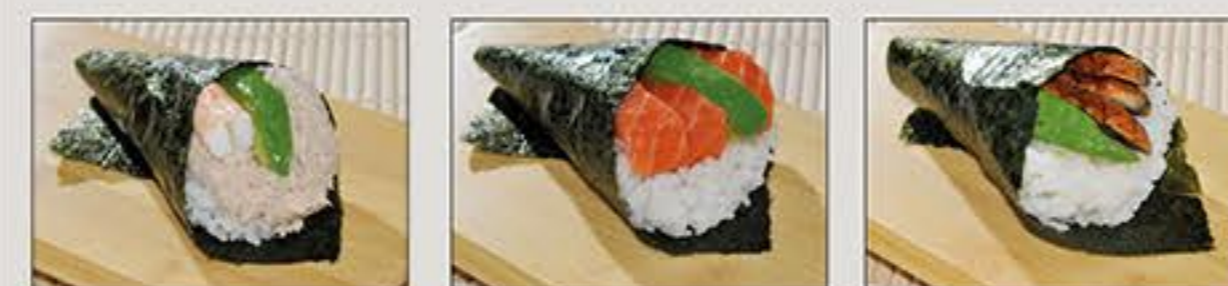
California Sake Anago