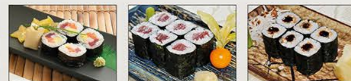
Futo Maki Tekka Maki Unagi Maki