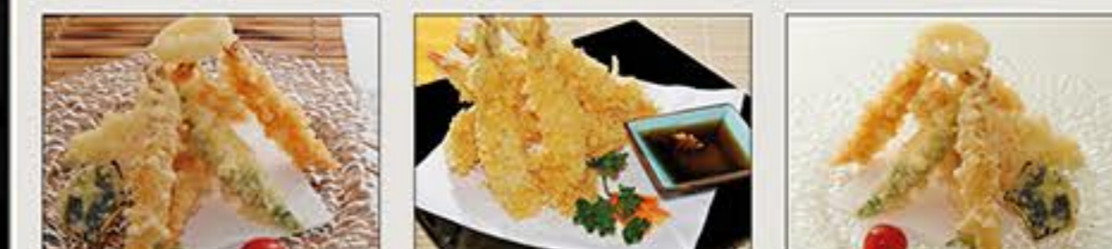
Kaisen Tempura Ebi Tempura Tempura Moriwase