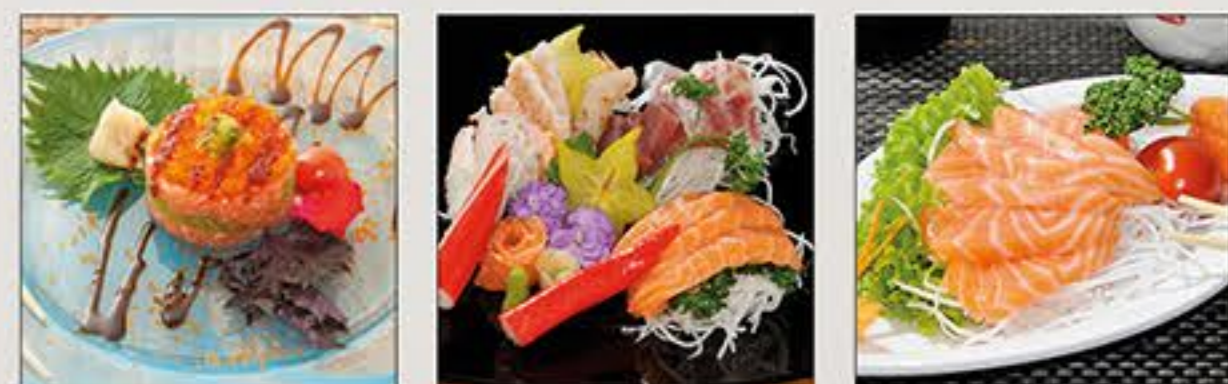
Sake Tartare Sashimi Misto Sashimi Sake