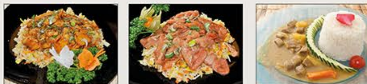
Riso Pollo Riso Filetto Curryrice