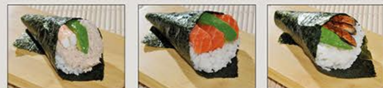
California Sake Anago