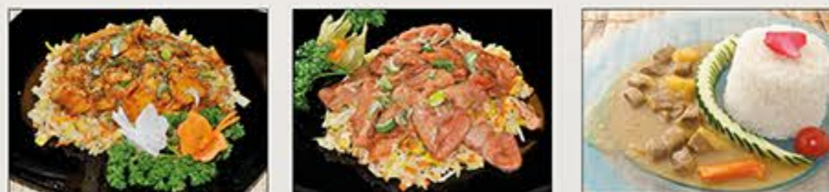
Riso Pollo Riso Filetto Curryrice