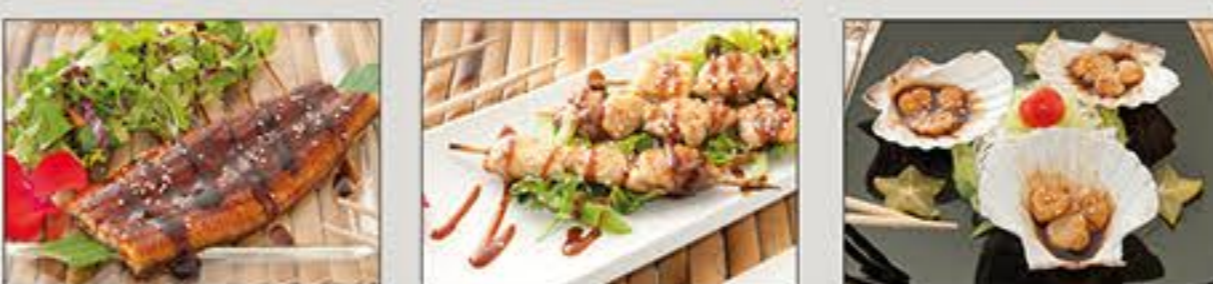
Unagi Kabayaki Yakitori Hotategai