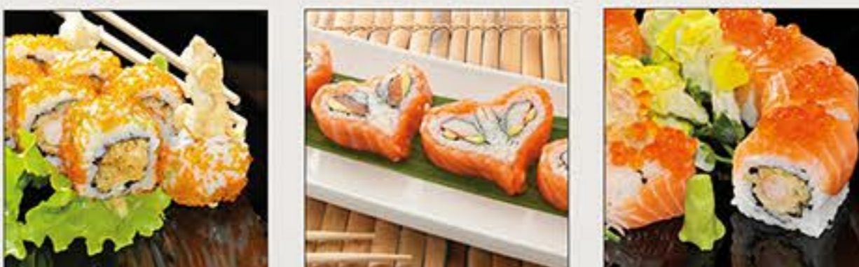
Tobiko Uramaki Love Maki Tiger Maki