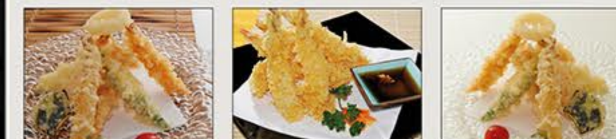
Kaisen Tempura Ebi Tempura Tempura Moriwase