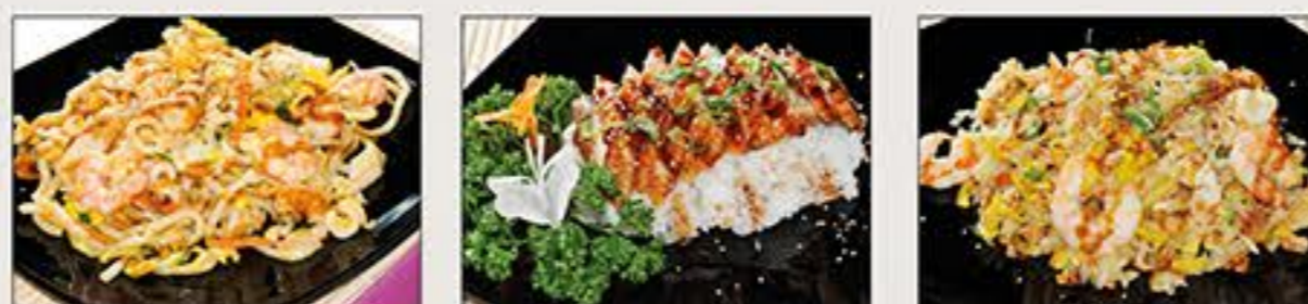
Spaghetti Udon Unagidon Riso Mare

SPAGHETTI SOBA € 8.00 Spaghetti di grano saraceno con misto mare