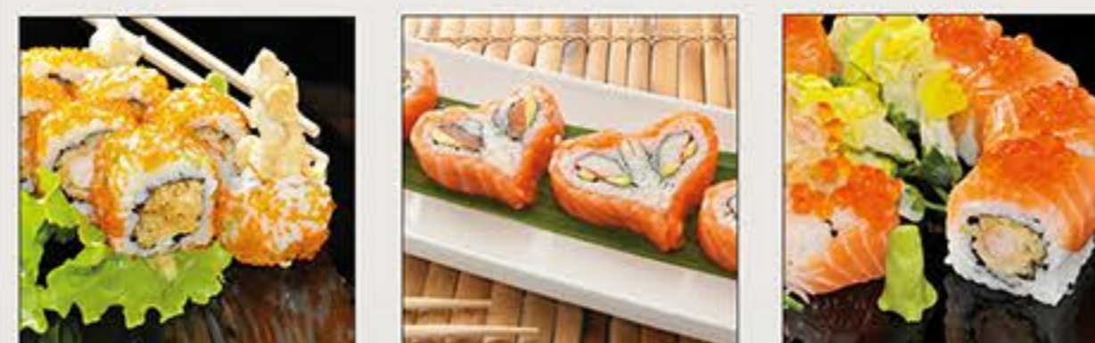
Tobiko Uramaki Love Maki Tiger Maki