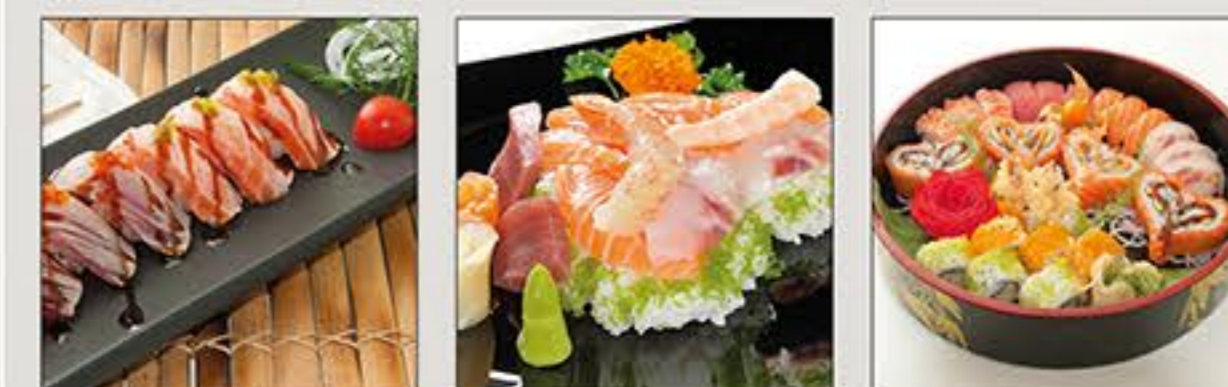
Sushi New Style Chirashi Sushi Matsu