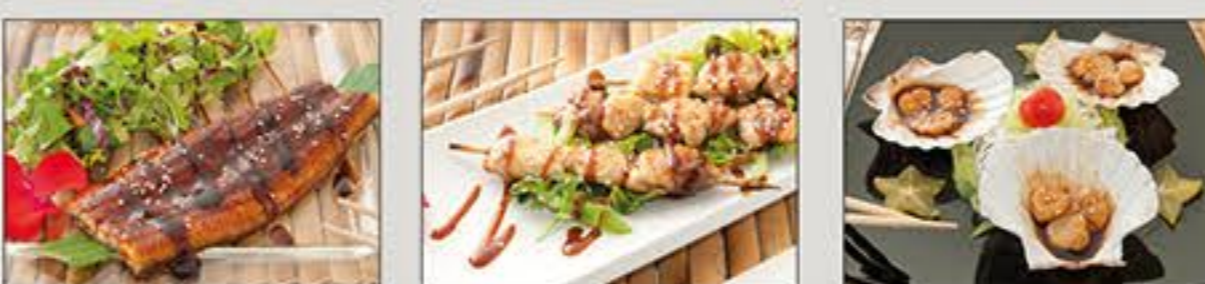
Unagi Kabayaki Yakitori Hotategai