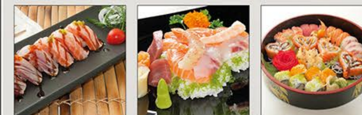
Sushi New Style Chirashi Sushi Matsu