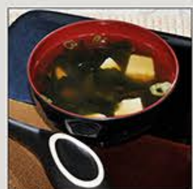
Zuppa di Miso