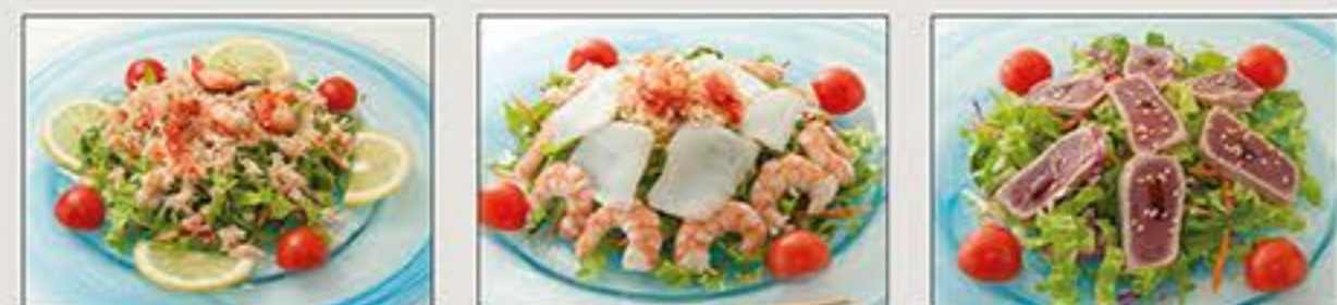
Kani Salad Kaisen Salad Maguro Salad