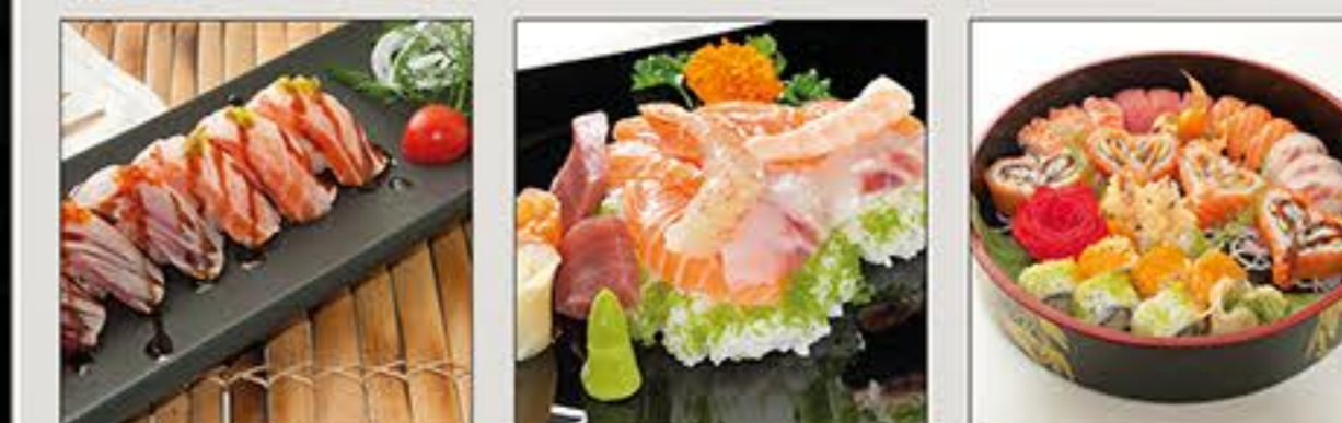
Sushi New Style Chirashi Sushi Matsu