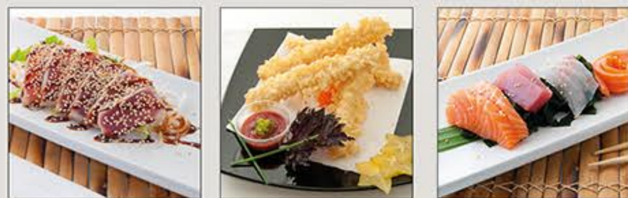
Maguro Tataki Samurai Stick Kaisen Suonomono