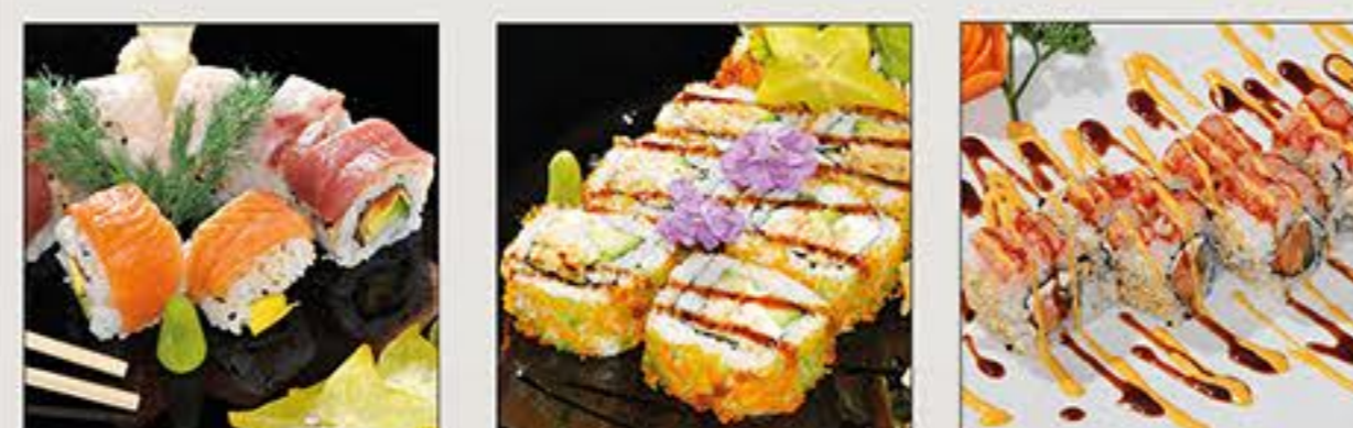
California Dream Softshell Maki Rosa Maki