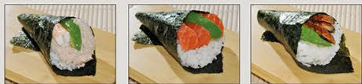
California Sake Anago